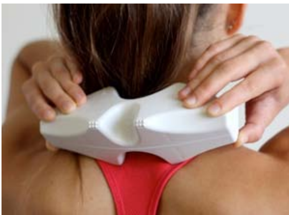
Рисунок 1. Аппарат Cordus